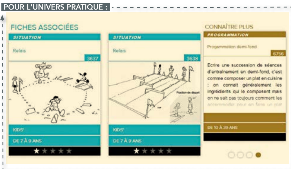
Figure 3 : Des fiches associées (situations) qui sont l'équivalent des variantes sur les CD et DVD. Des fiches « Connaître plus » (contenus théoriques) qui sont mises dynamiquement ou manuellement