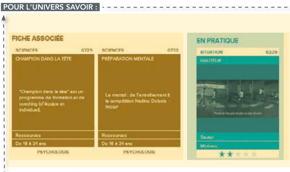
Figure 4 : Des fiches associées (d'autres contenus théoriques). Des fiches « En pratique » (situations ou progression, cycles,...) qui sont mises manuellement

→ Les liens dynamiques s'établissent à partir du moment où les fiches ont les mêmes mots clés.